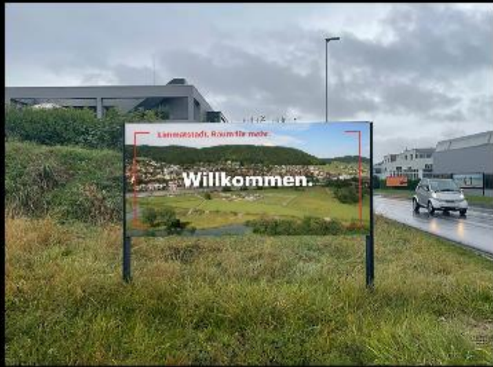
Standort Geroldswil mit Luftaufnahme Geroldswil