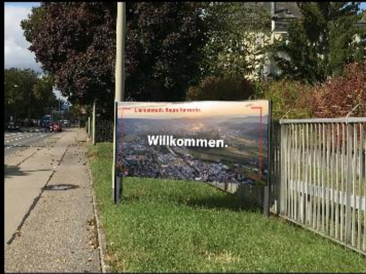
Standort Schlieren mit Luftaufnahme Schlieren