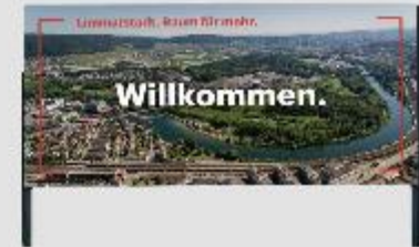
Standort Dietikon mit Luftaufnahme Dietikon